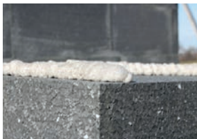
Nagy sűrűségű összetétel

A Tytan Professional Styro Pro ajánlott szigetelőlemezek beépítéséhez az ETICS rendszerben. Az egyedülálló nagy sűrűségű összetétel biztosítja az azonnali ragasztást, erős kötőerőt, és könnyű szintezési lehetőséget. Biztosítja, hogy a szigetelési munka könnyebb és gyorsabb legyen.