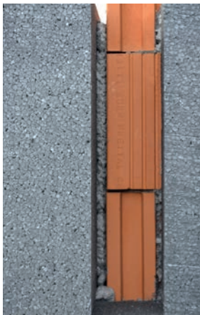
30 mm fal korrekció lehetősége

A Styro Pro ragasztóhab alkalmas expandált polisztirolhoz (EPS), extrudált polisztirolhoz (XPS), poliuretán táblákhoz (PUR), ásvány gyapot táblához és habüveghez. A termék sokféle építőanyagban és felületeken alkalmazható: beton, fa, OSB, bitumen membránok, kerámia téglák, szilikát téglák, üveg, fém és PVC.